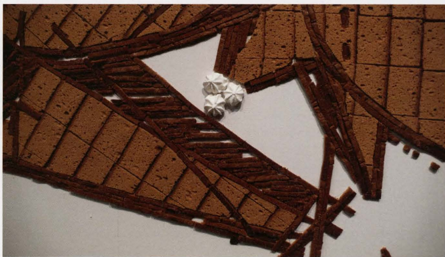
ardust, 2006, 140 x 390 cm, peperkoek, eringue en biscuit