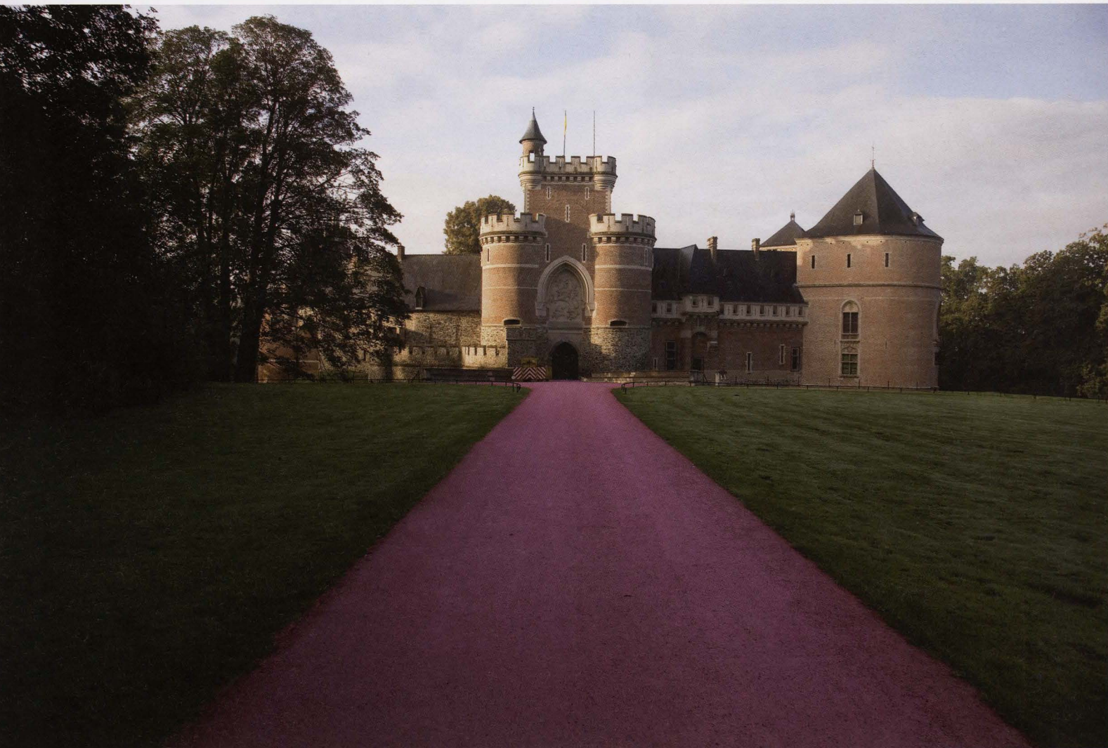
The Weight of Wonder , 2008, 100 x 4 m, 15 ton roze kiezelstenen

weg te werken, zette ze die net in de verf door gekleurd pigment in het plamuursel toe te voegen. Nadien bracht ze pin ups, palmbomen en andere herkenbare figuren uit de populaire cultuur op de muur aan met boorgaten.